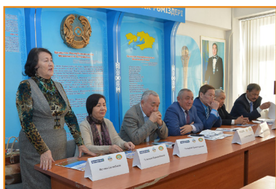
«QAZAQSTAN» телеарнасының майталмандарымен кездесу