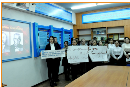
«Алаш алыптарының кітап басу ісіне қосқан үлесі», ашық сабағынан көрініс