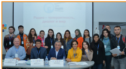
Халықаралық журналистика және коммуникация қысқы мектебінде шетелдік студенттермен