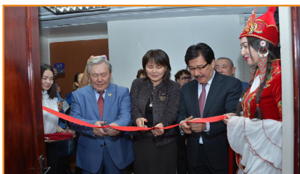
«QAZAQSTAN» оқу зертханасының ашылу салтанаты

«QAZAQSTAN» оқу-шығармашылық зертханасы журналистика медиа және коммуникация саласында шеберлік-сыныптарын өткізумен қатар іргелі және қолданбалы ғылыми зерттеулер жүргізу болып табылады.