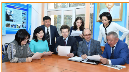
ЮНАИИ Хаб кезекті мәжілісінде