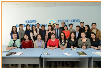
Студенттік баспасөз орталығы