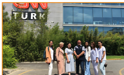
Факультет студенттері CNN Түркия қызметінде тәлімгерлікте