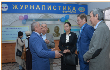
Ардагерлер алаңынан сыр сұқбат