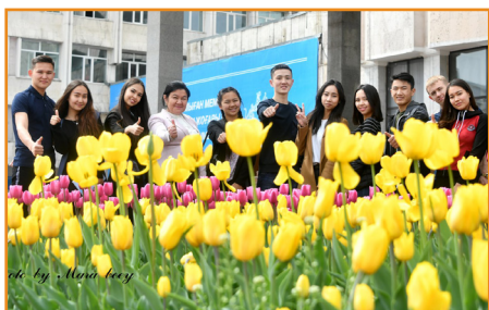
Студенттер фотожурналистика дәрісінде