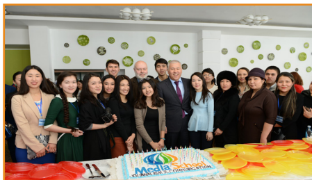
Халықаралық журналистика және коммуникация қысқы мектебі