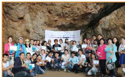
Медиа сауаттылық керуені. Түркістан облысы, Ақмешіт